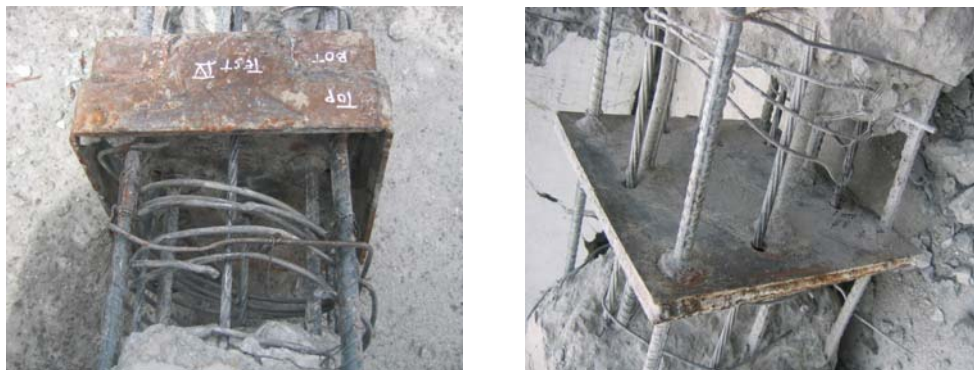
Gambar 1 Struktur Tiang Pancang Prategang