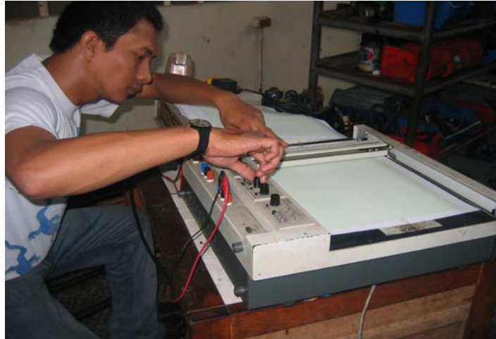
Gambar 5 X – Y Recorder